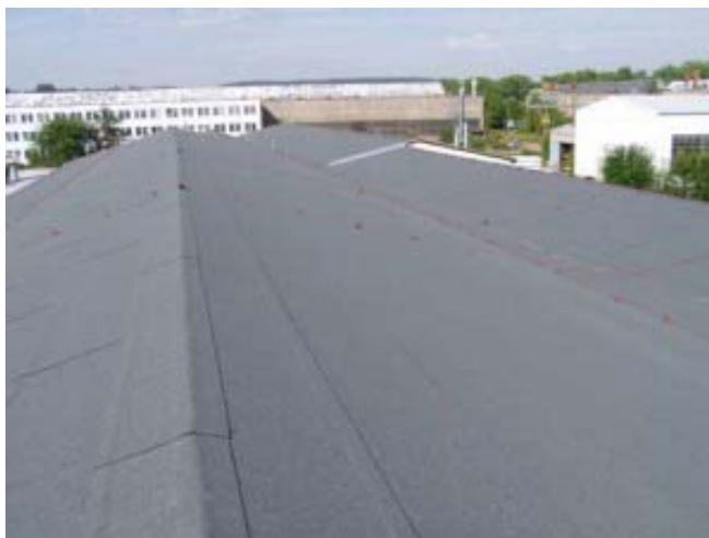
Pohled na střechu